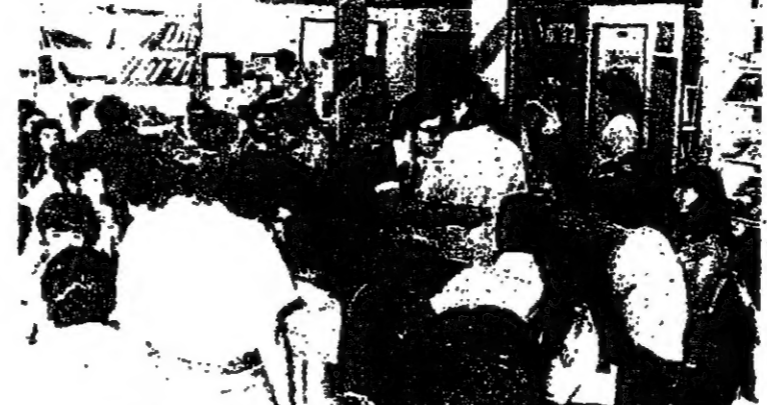
اجتماعات التعارف بين الطلاب العرب واليهود

ج - التمهيد لاجل ان تطيق المشروع بين ابناء الشعبين في البلد الواحد ،